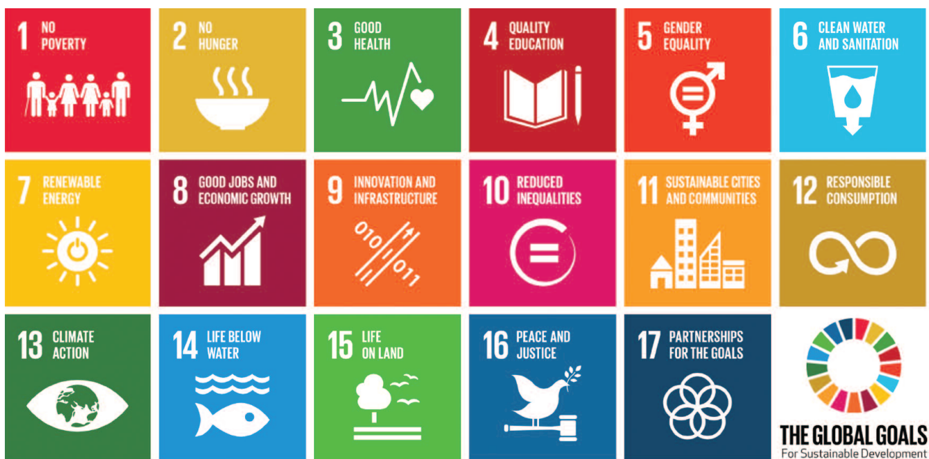
Fíor 5: Spriocanna Forbartha Inbhuanaithe na NA (SDGanna) - 17 Sprioc chun an Domhan a Fheabhsú

Rith Comhthionól Ginearálta na Náisiún Aontaithe rún i Meán Fómhair 2015, trínar glacadh go foirmeálta le 'Clár Oibre 2030 don Fhorbairt Inbhuanaithe'. I gcoírlár Chlár Oibre 2030 don Fhorbairt Inbhuanaithe bhí 17 Sprioc Forbartha Inbhuanaithe (SDGanna) mar atá leagtha amach i bhFíor 5 thíos..