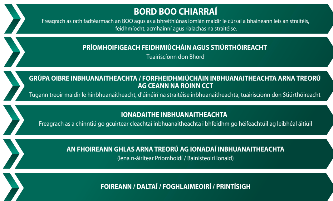
Fíor 7: Rialachas Inbhuanaitheachta BOO Chiarraí

Amlíne chomhfhreagrach maidir leis an aistear i dtreo inbhuanaitheacht níos fearr ar fud BOO Chiarraí mar a leanas: