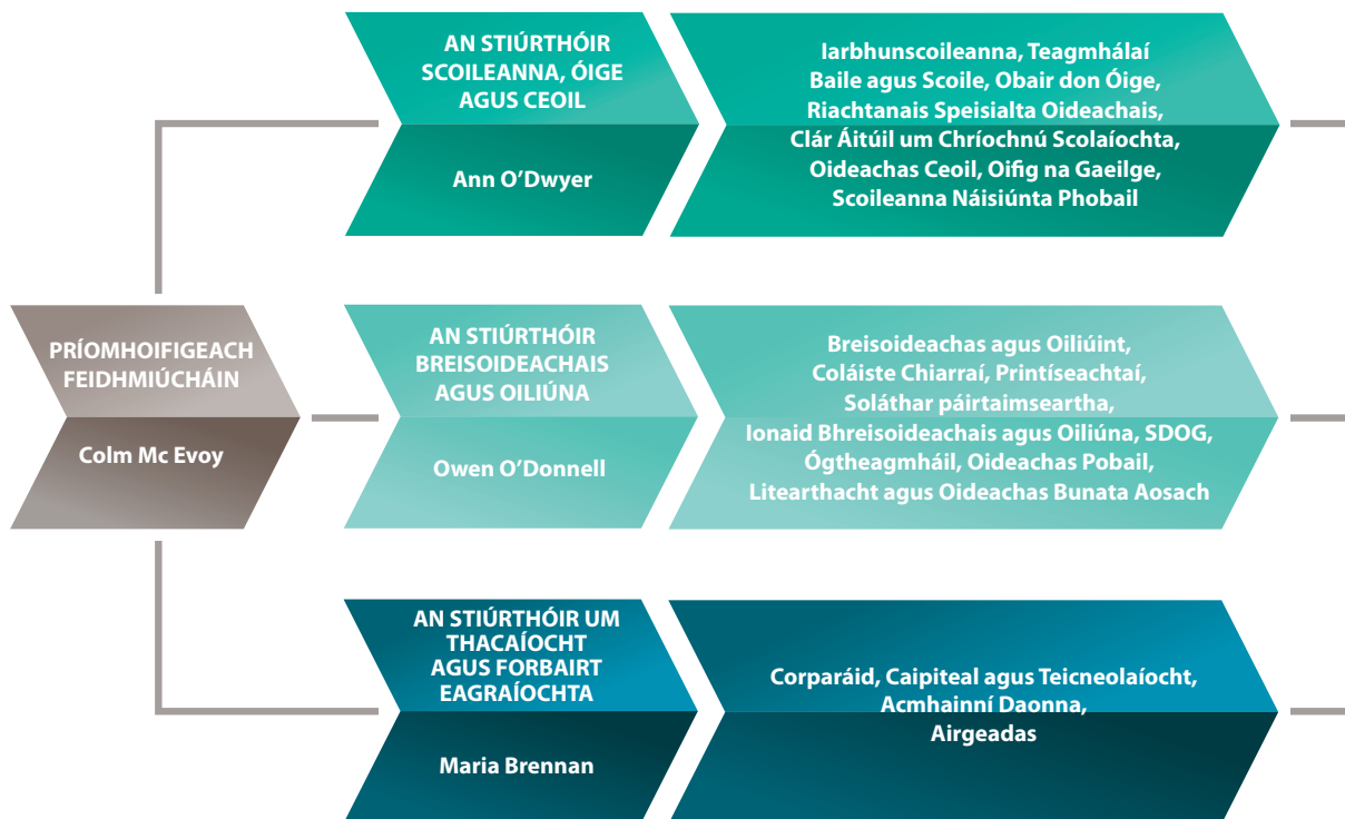
Fíor 2: Struchtúir Eagrúcháin

Léirítear sa chart eagraíochta ardleibhéil seo a leanas struchtúr foriomlán eagraíochtúil BOO Chiarraí.