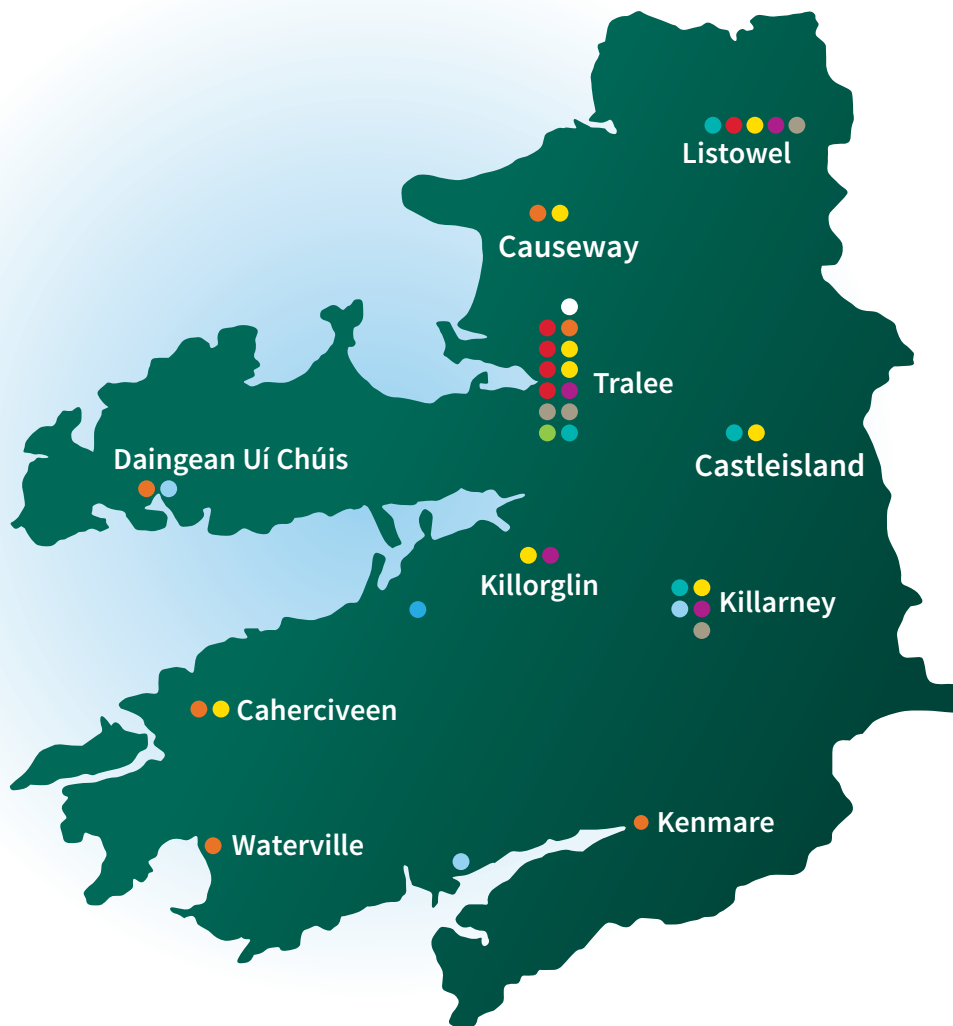
Fíor 1: Láithreacha Ionaid BOO Chiarráí

Tá deiseanna oideachais agus oiliúna á gcur ar fáil ag BOO Chiarráí i láthair na huairé do bhreis is 15,000 foghlaimoir in aghaidh na bliana. Tá breis is 1,100 ball foirne fostaithe san eagraíocht arb ionann a buiséad agus c. €67 milliún.