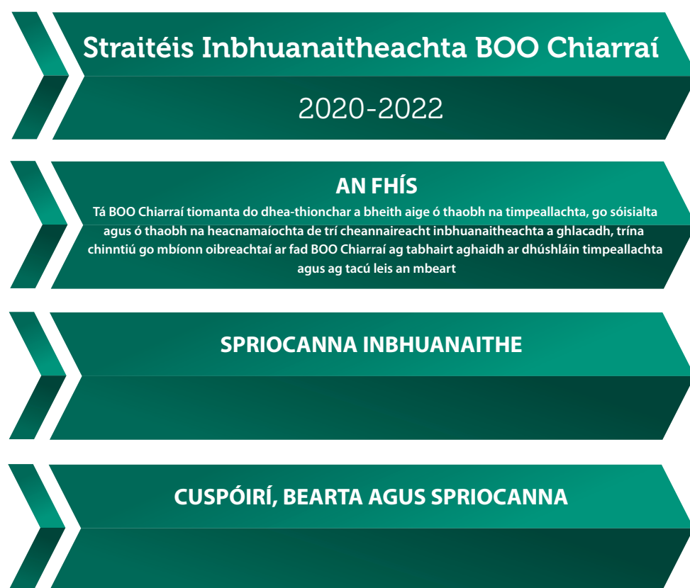
Fíor 4: Creat na Straitéise

Is mar seo a leanas a leagtar amach Straitéis Inbhuanaitheachta BOO Chiarraí 2020-2022 :